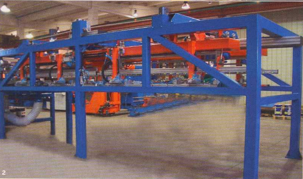
1 _ Kompletanlage zum Längsteilen von Faspars. 2 _ Eine Stapelanlage mit zwei Stationen für eine schnelle Querteilanlage.

Westlich von Mailand liegt das Betriebsgelände von Faspars. »Wir verfügen über eine Fertigung von 4.000 Quadratmetern und überlegen, noch eine weitere Halle zu mieten«, erzählt Dott.ssa Maddalena Aime, die Verantwortliche für den Vertrieb des Maschinenbauers.